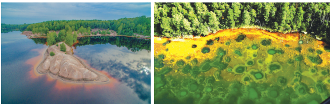
Grube Babina Tagebrüche Grube Frieden